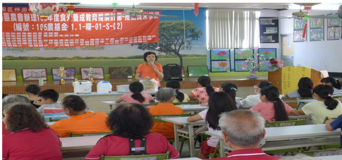
老師講解煮飯的方法和技巧