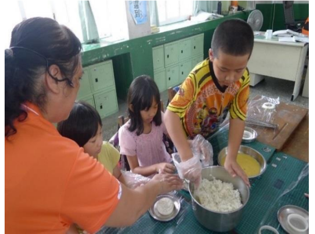
老師示範料理技巧