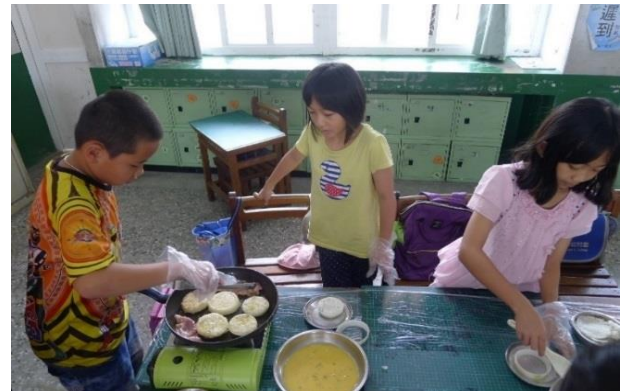
學童自己煎肉及飯塔