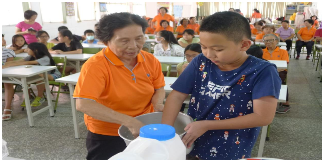
社區阿嬤教小朋友煮飯