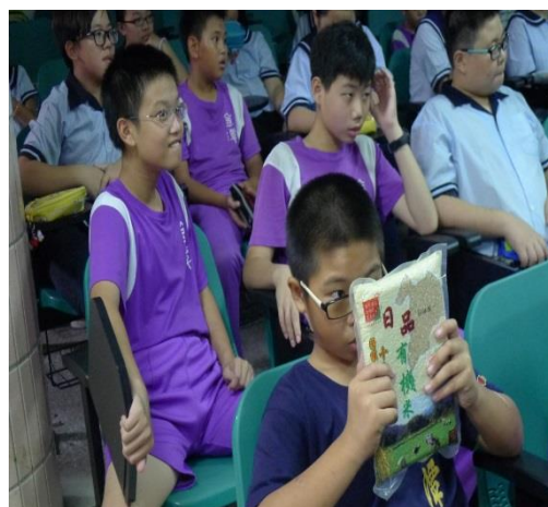
學童細心觀察包裝米及各種米