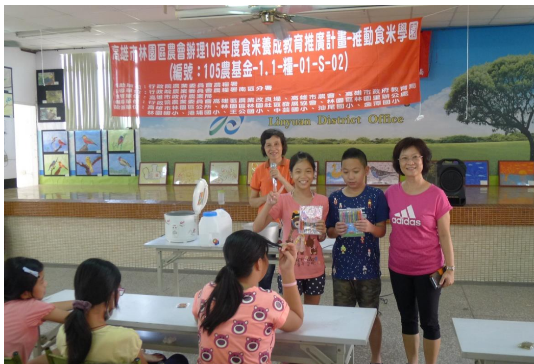
頒發上台煮飯及有獎徵答學童獎品