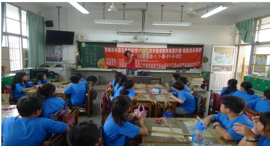
老師講解稻草由來及利用