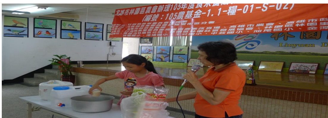
學童親自學習煮飯