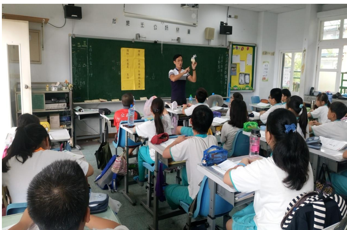
老師拿各種米讓小朋友觀察分辨