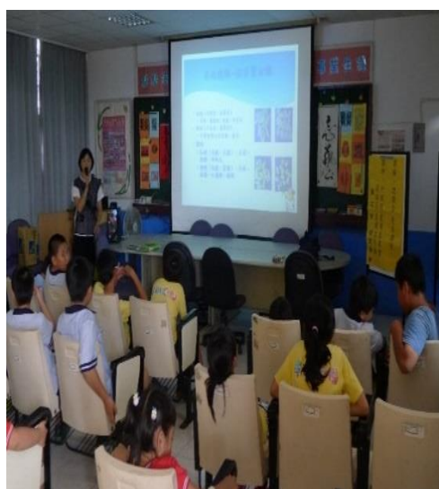
學童認真聽講及回答問題