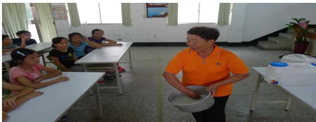
高齡者示範煮飯的方法