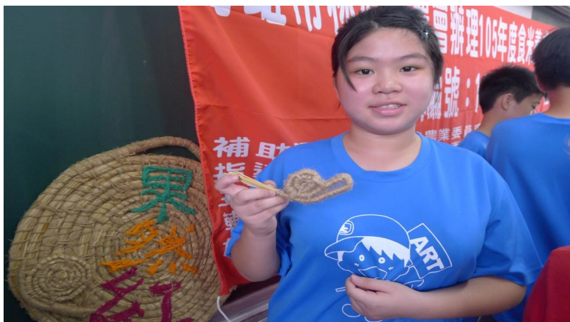
女生第一位做好作品