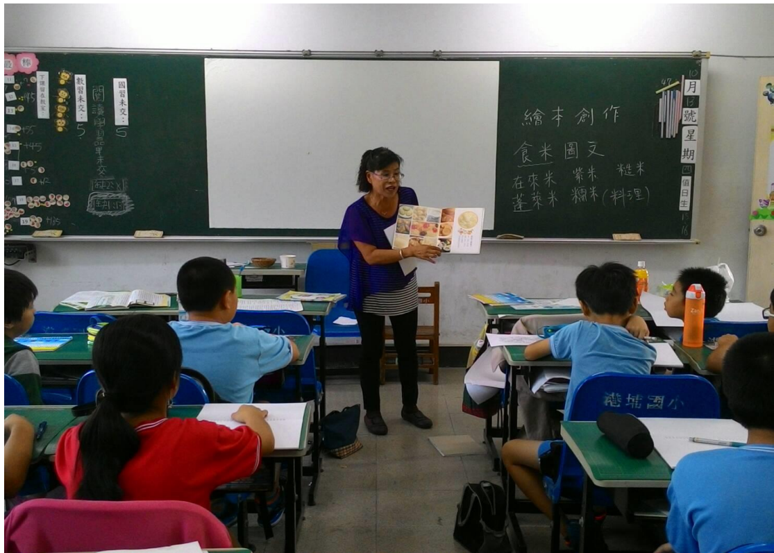
老師介紹各式米食種類