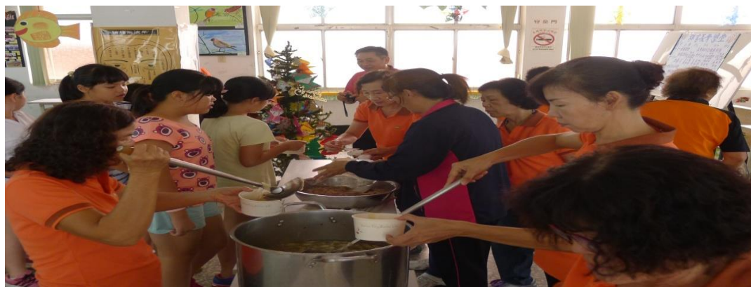
開心陪伴阿公、阿嬤用餐