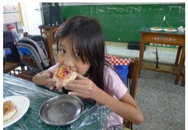
學童忍不住了大口大口吃