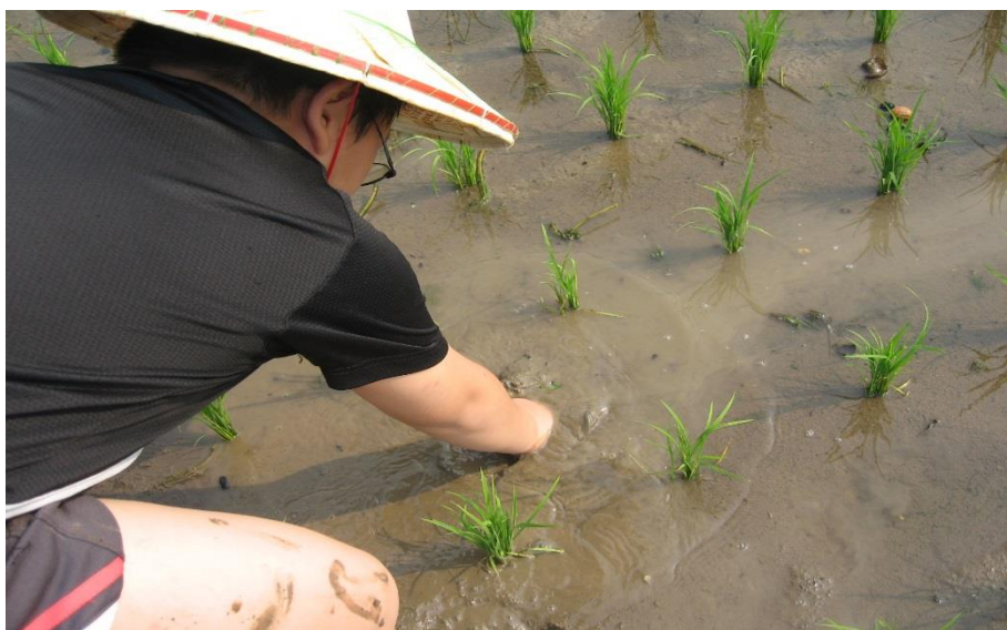
學童利用綜合課、暑假至稻田除草觀察田裡生態