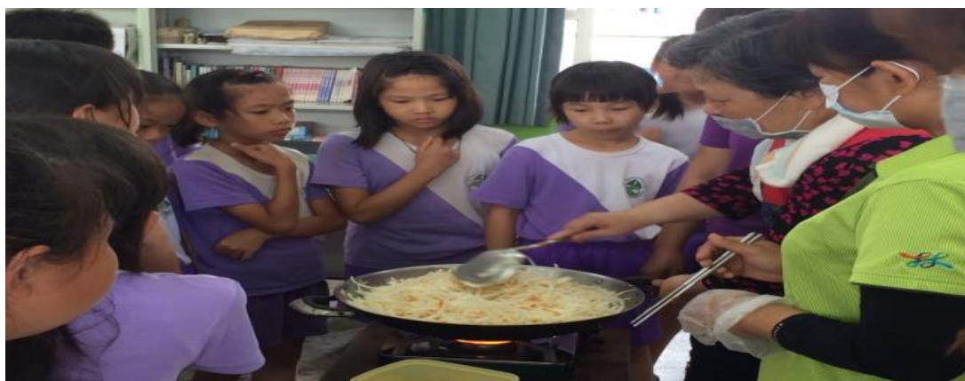
吃飯團配洋蔥炒蛋