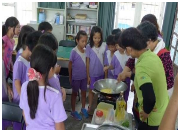
老師示範炒飯的技巧