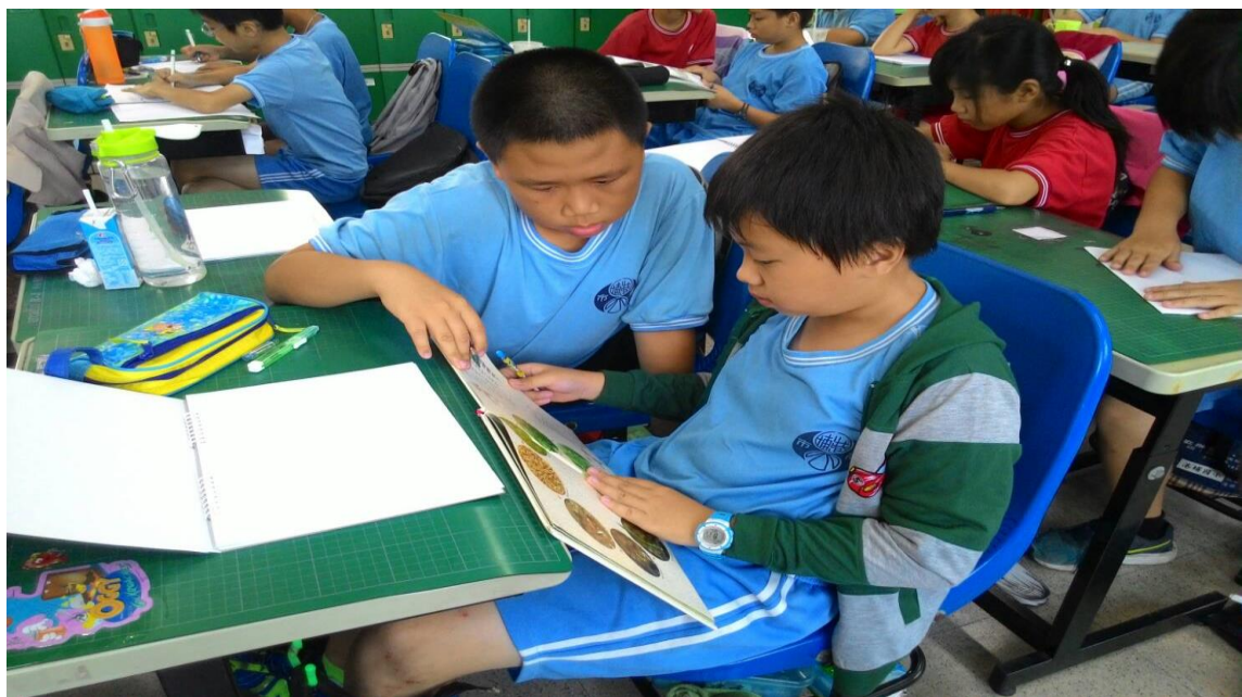
學童翻閱收集米食書籍