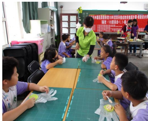
學童親自下廚炒飯