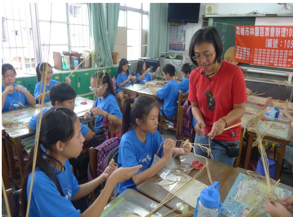
教小朋友編織稻草