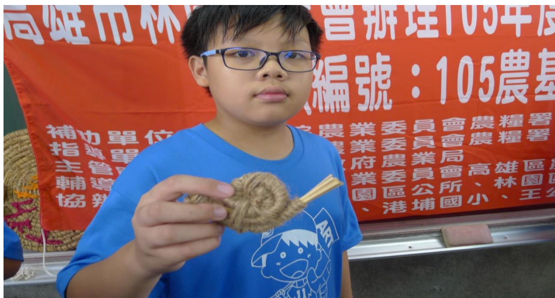
男生第一位做好作品~鍋牛