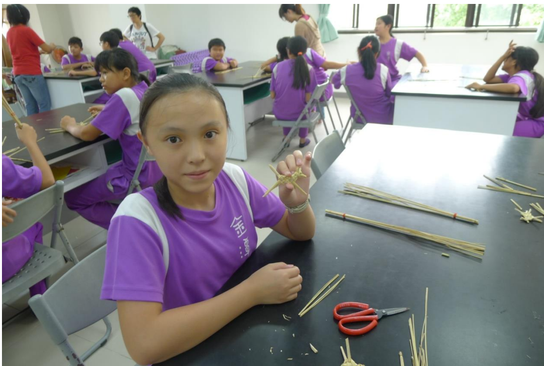
展現稻草編織作品~狗狗