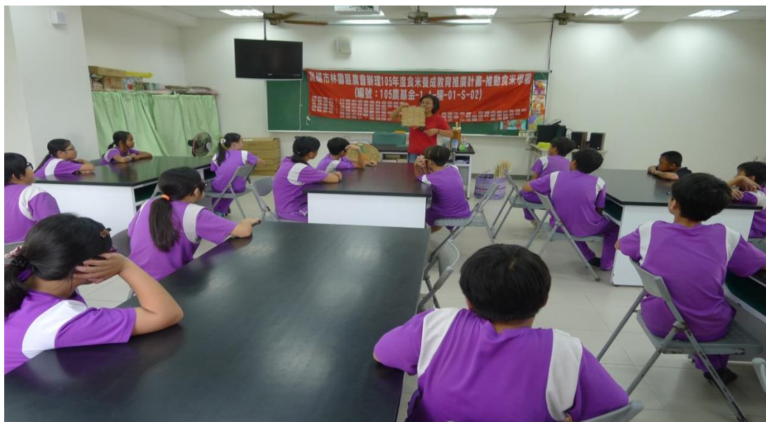
學童認真學習製作